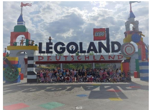
Ausflug ins Legoland 2023

Wildpark Sommerhausen Besuch im Freizeitpark/Zoo Kegelbahn Walderlebniszentrum Spielplatz Veitshöchheim Schlossmuseen Rimpar (Archäologie, Bäckerei) Führung im Mineralogischen Museum Würzburg Wasserspielplätze Güntersleben, Lengfeld, Kürnach