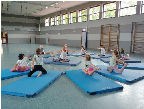
Turnhalle „Neue Siedlung“