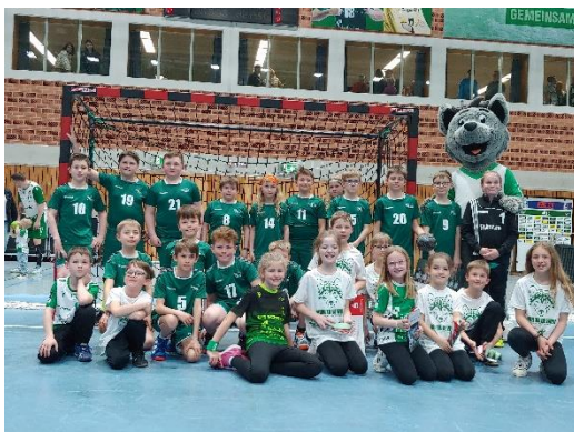
Einlaufkids bei den „Würzburger Wölfen“