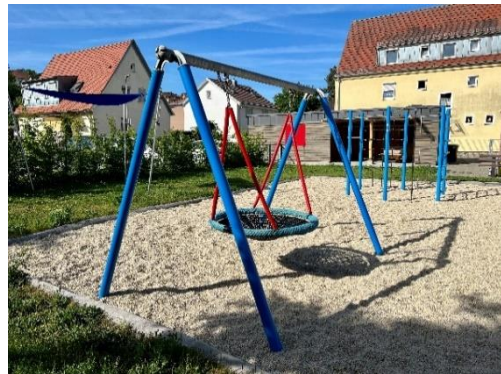
Spielfläche am Kinderhort