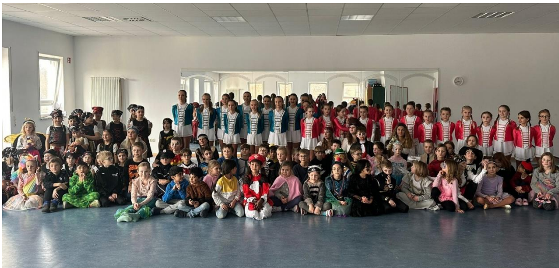
Faschingsfeier und Auftritt der „Rimparer Faschingsgarden“ 2023