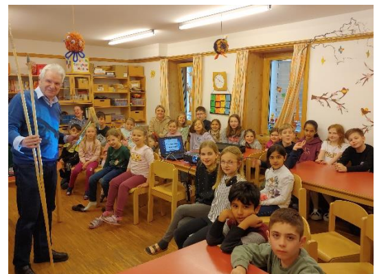
„Steinzeitprojekt“ in den Osterferien 2023